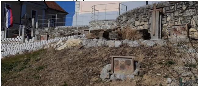
Kulturni praznik s Prešernovo pesmijo