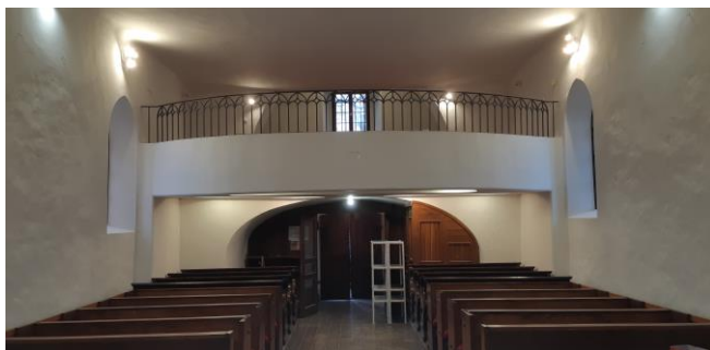
Pripravljena mesta za obnovljen križev pot