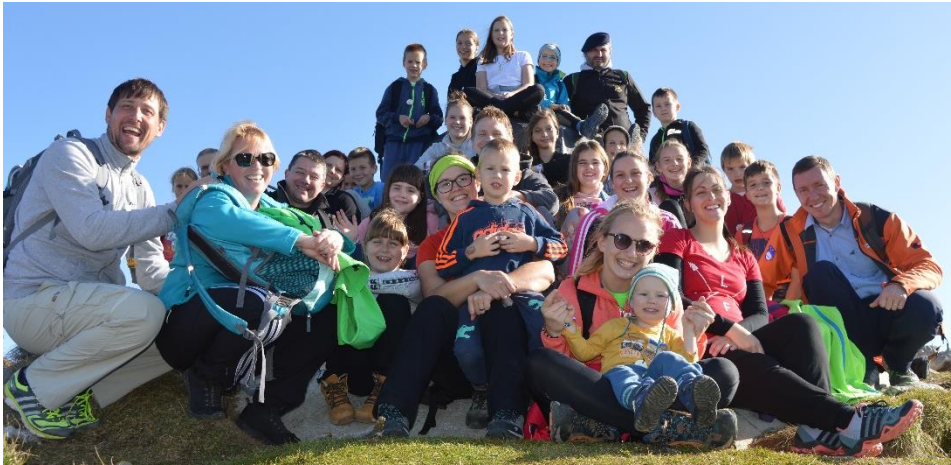
Romanje s Kolpingovo družino v Kropo in na Brezje