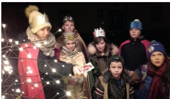
Koledovanje na Skopicah in uspele žive jaslice.