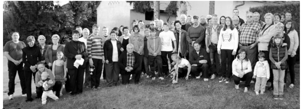
ČREŠNJICE OB POSADITVI VAŠKE LIPE