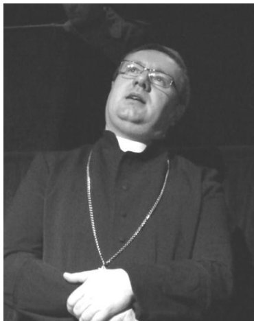
igra "V imenu Ljudstva"