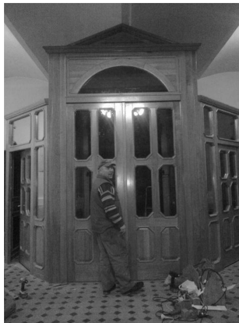
NOV VETRLOV