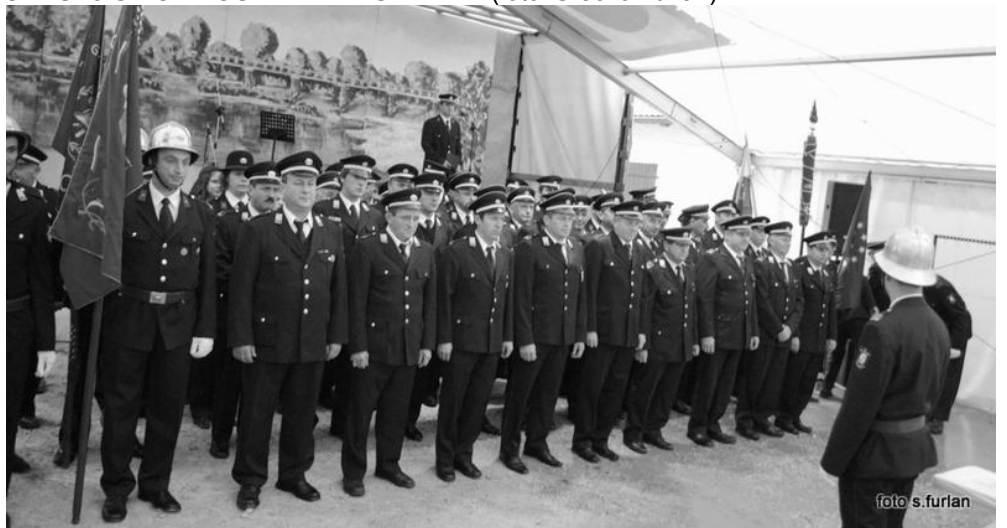
GASILCI OB 110-LETNICI USTANOVITVE