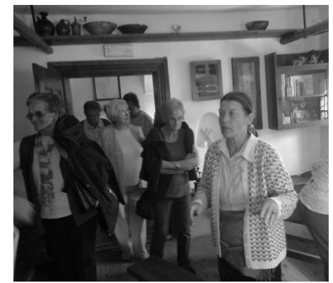
ROMANJE NA BREZJE IN V VRBO