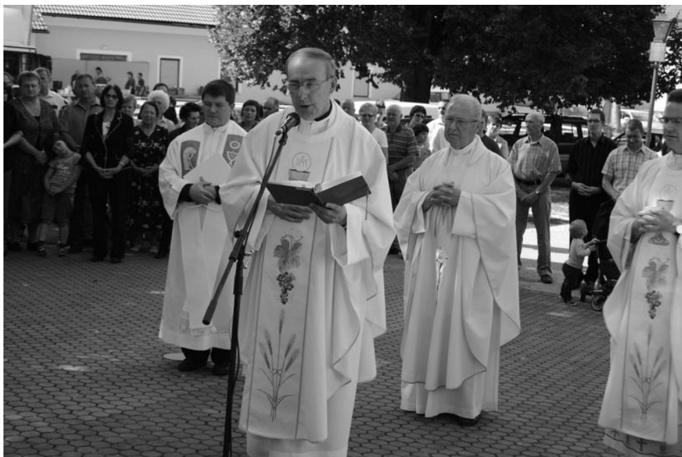
BLAGOSLOV NOVEGA VETROLOVA OB DNEVU FARANOV IN JUBILEJI