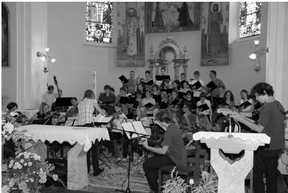
KONCERT MALDIH IZ ŽUPNIJE JEŽICA