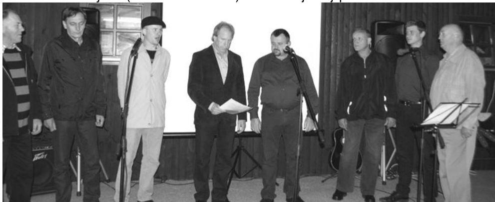
Knjiga Silvestra Lopatiča: "Boršt skozi čas"