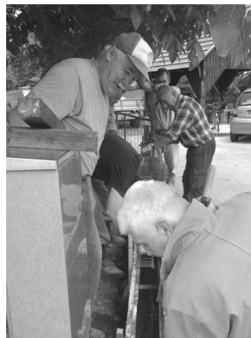
nova ograja v Krški vasi