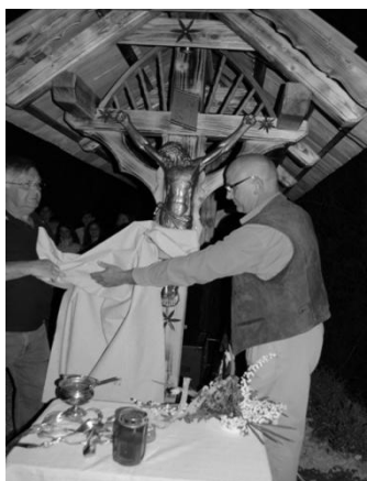
nov križ na Črešnjicah