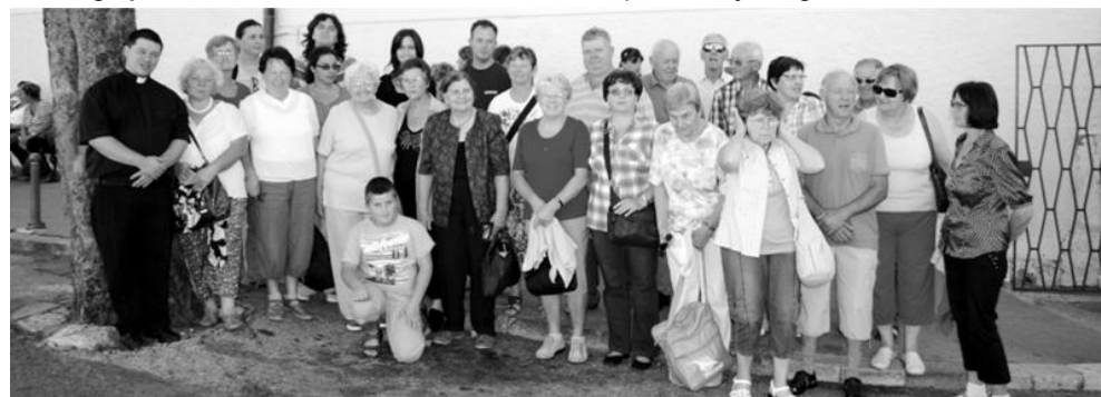
romanje na Trsat ↑