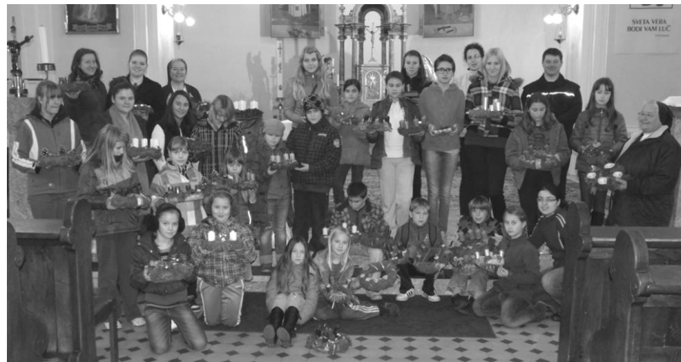
KO SMO DELALI VENČKE.

Tudi v župniji so bila na marsikaterem božjem znamenju in kapelici opravljena obnovitvena dela, kar kaže veliko prizadevnost faranov, da bi vasi ne samo ohranjale kulturno dediščino, temveč da bi se s tem krepila tudi vera ljudstva.