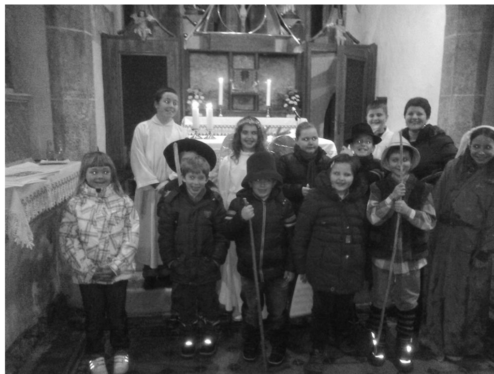
UTRINKI IZ OTROŠKE POLNOČNICE V KRŠKI VASI.